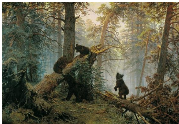
Mañana en un bosque de pinos (1878), Ivan Shishkin.

Aunque su ámbito de producción era variado, es en el paisaje como género donde la escuela desarrolló su actividad, a través de la Sociedad de Exposiciones itinerantes de arte fundada en 1870. De esta manera, comenzará a divulgar el espíritu y poner en valor las bellezas naturales de Rusia, a concienciar en su preservación dándole un carácter nacional de unión, y junto con la reproducción fotográfica de las obras, a extender la popularidad de las obras de pintura de la escuela.