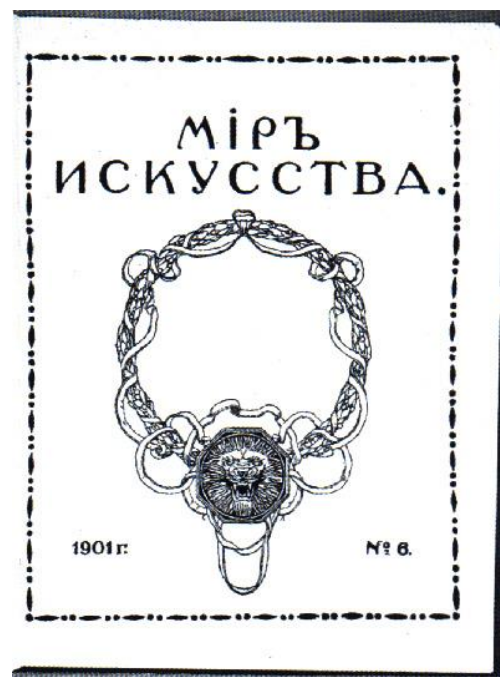
Portada del n° 6 de Mir iskusstva 1901, publicado entre 1898 y 1904. Diághilev y los Ballets Rusos.

esencia de Mir iskusstva , que como evolución lógica de los tiempos, fue introduciendo nuevas formas artísticas y nuevos miembros renovadores. A pesar de ello, continuaron las exposiciones hasta 1927, con el nombre de Mir iskusstva .