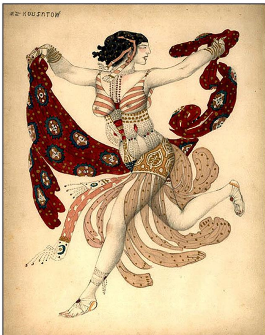
L'ocell de foc , según la versión de Mijail Fokine .

Fundamental para Diághilev fue el director artístico León Bakst , con quien había fundado Mir iskusstva , y músicos como Ravel y Debussy , pero sobre todo Igor Stravinski .