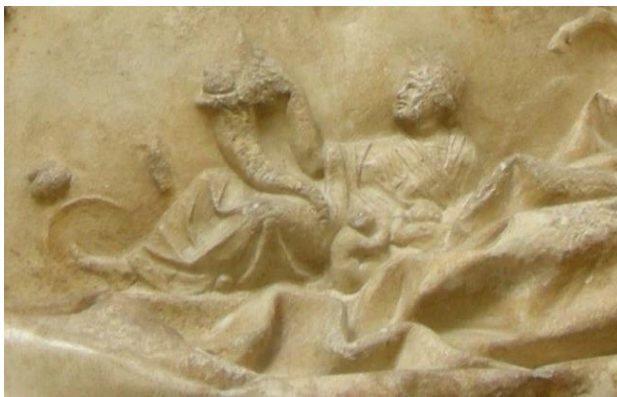
Tellus con el cuerno de la abundancia. Detalle.

también presentes en los festejos de los ludi saeculares -escenificaciones y rituales de referentes a la paz y la salud que trae la fecundidad y viceversa-, los cuales se relacionan con las iconografías de Venus y Ceres , que para Augusto forman parte inquebrantable de la nueva era de prosperidad.