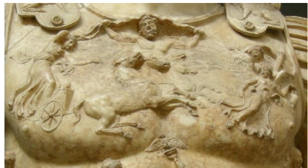
Caelus dios de los cielos. Detalle.

A la izquierda de esta escena Hispania en posición afligida sujetando la gladius Hispaniensis , referencia a la victoria de Augusto sobre cántabros y astures. Frente a ella, la Galia vencida con atributos celtas, trompeta de guerra, la enseña con un jabalí y la espada envainada. Bajo estas escenas a la izquierda, Apolo a lomos de un grifo portando la lira, y frente a él a la derecha del escudo, Diana sobre un ciervo, con el carcaj 211 y una antorcha. En la parte inferior de la coraza está Tellus , la diosa de la tierra que sujeta el cuerno de la abundancia de Amaltea amamantando a dos niños, y que cierra el círculo iconográfico de la coraza de Augusto.