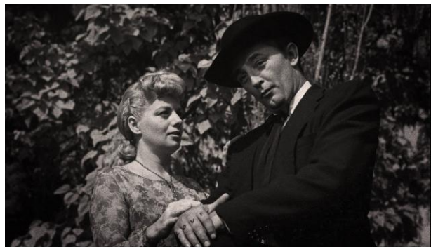
Harry Powell y la viuda Harper

años, se unen el guionista y el actor principal, quienes tenían un gran interés en la participación de la película. Por otra parte, su director aun sabiendo que esta iba a ser una producción modesta, tenía la esperanza de poder plasmar en pantalla desde una perspectiva visual añeja, el universo psicológico e inquietante en que se desenvuelven los hermanos 70 .