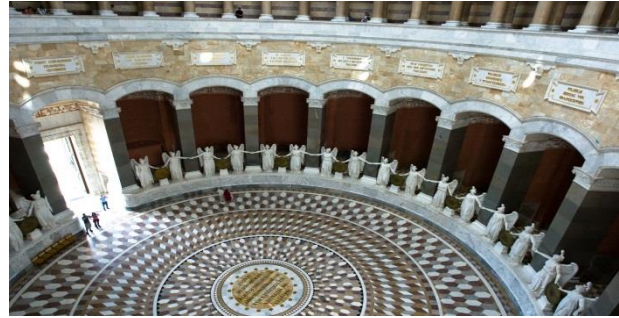
Befreiungshalle Sala de la Liberación en Kehlheim. Leo von Klenze 1863

las Guerras Napoleónicas. Fueron directamente inspirados en la arquitectura griega clásica.