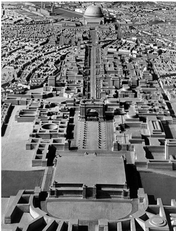
Maqueta del proyecto para el centro de Berlín. Alemania. Albert Speer.

El centro de Berlín será el lugar simbólico donde poner en práctica todo el empeño de la creación de una nueva Alemania por medio de la monumentalidad excesiva. Albert Speer el arquitecto que mejor supo entender la grandiosidad y la intimidación por medio de arquitecturas parlantes en cuanto al componente psicológico que las dimensiones provocaban en quien las observaba, llevo a cabo una serie de proyectos, la mayoría de ellos inconclusos debido al estallido de la guerra, que harían realidad la idea de la capital del Reich como nueva Roma Imperial.