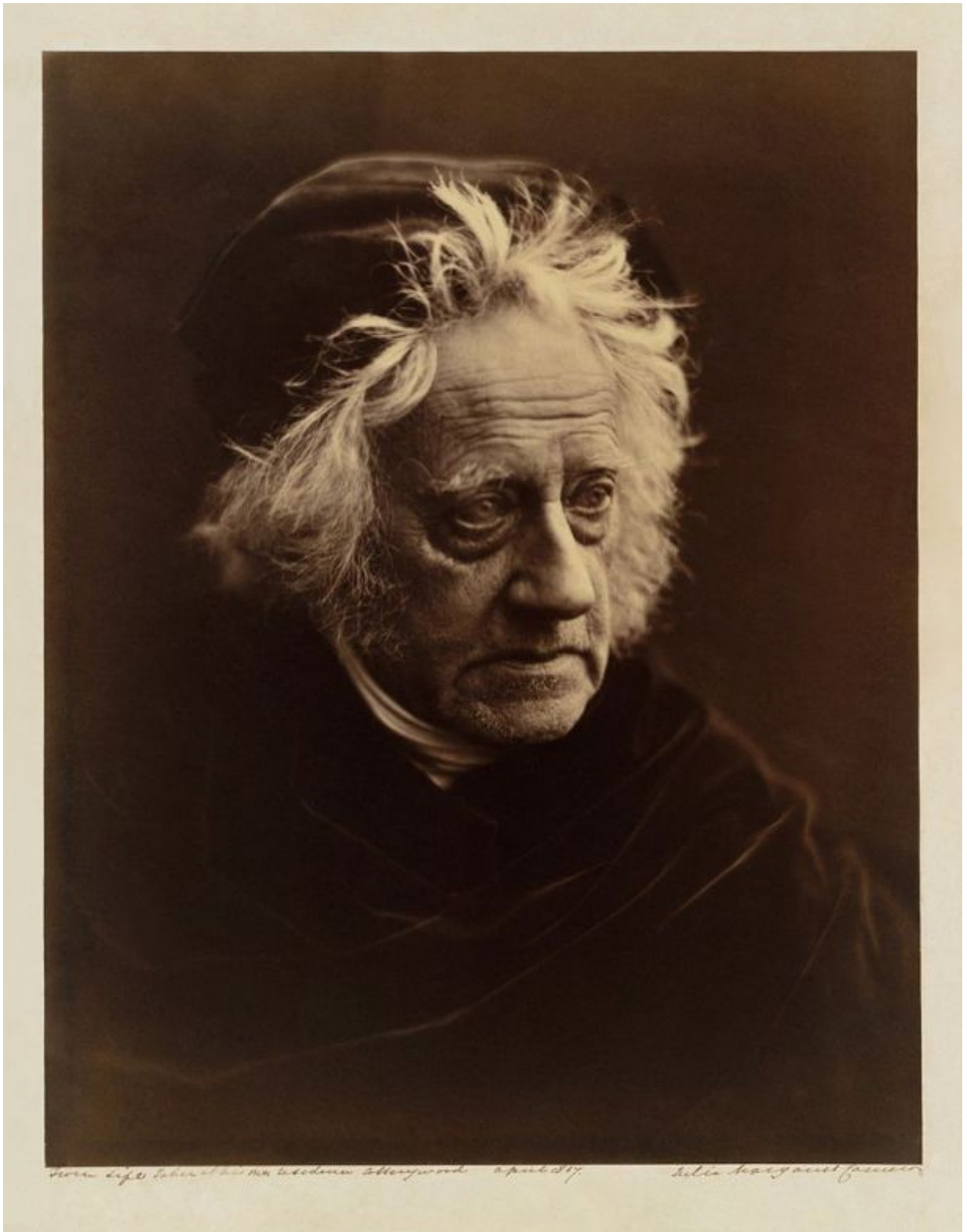
John Herschel. Julia Margaret Cameron. Metropolitan Museum of Art