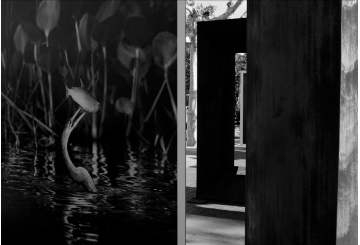
Fotografías de la exposición urbana Génesis de Sebastiao Salgado

Cuando en la guerra de Vietnam se comienza a utilizar la película en color, los heridos y la sangre eran mucho más impactantes y dramáticos que en anteriores guerras donde el blanco y negro imperaba a la hora de dar las noticias, ¿necesitamos que nos vendan la tragedia en color para mentalizarnos y concienciarnos de que el drama es mayor aún? El drama es el mismo y a quien aparece retratado en su miseria, no le va a importar si va a ser consumido en blanco y negro o en color por el espectador de una galería de arte o por quien observa un libro de fotografías, con mantenerse vivo e intacto sería suficiente.