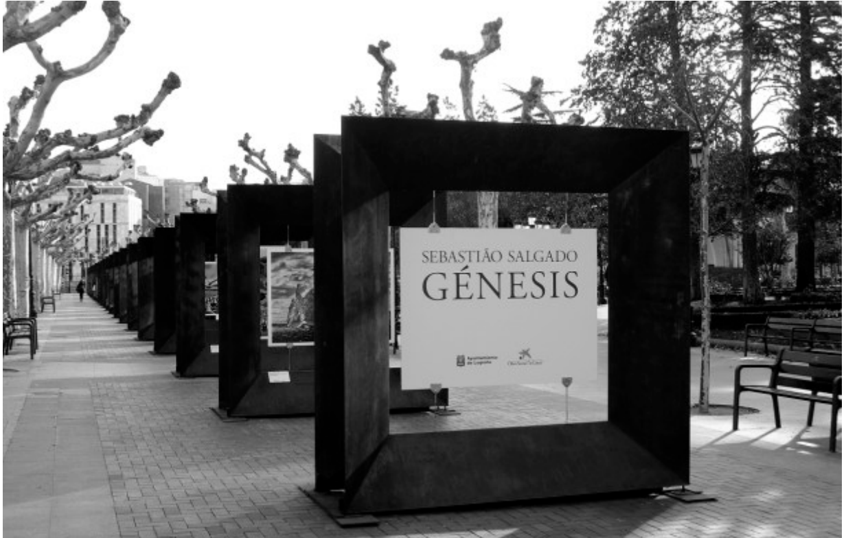
Fotografías de la exposición urbana Génesis de Sebastiao Salgado