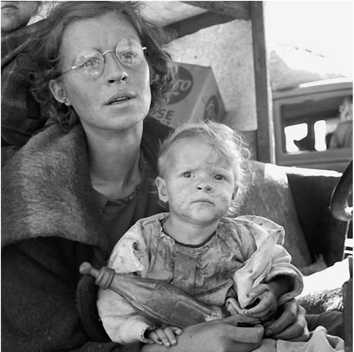
Fig.3 Mother and baby of family on the road. Tulelake, Siskiyou County, California. 1939

Los tres ejemplos de madres migrantes, son ejemplos de desesperanza, ninguna mira hacia la cámara, esto es algo relevante en cuanto que es la línea del horizonte lo que buscan sus ojos, es un horizonte que probablemente no sea ni de esperanza alguna, pero ni aún interrumpiendo el fotógrafo la línea visual de las mujeres, éstas dejan de mirar más allá.