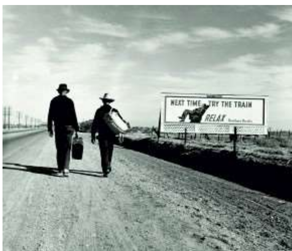
Fig.7 Try the Train, 1937