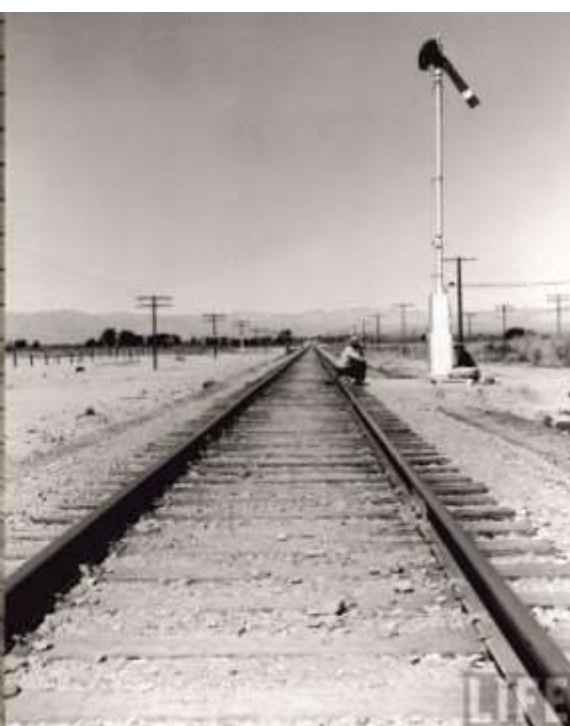
Fig.10 Itinerant men. 1939

Si la miseria engendra miseria, envolverse en ella y respirarla la perpetúa e ineludiblemente se termina formando parte del paisaje confundiendo en él.