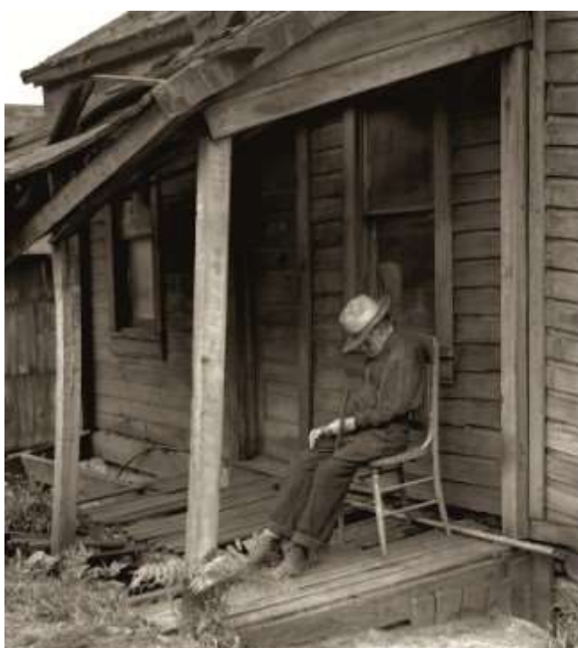
Fig.9 Washington, Pennsylvania. 1936