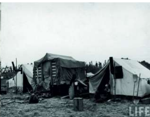
Fig.8 Homes belonging to Okies, dust bowl refugees, 1936