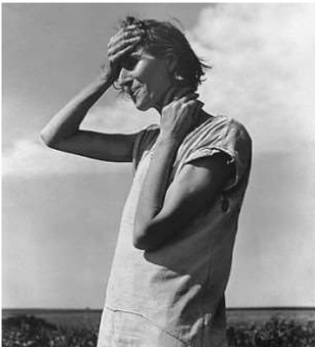
Fig.1 Mujer en High Plains. Panhandle. Texas 1938