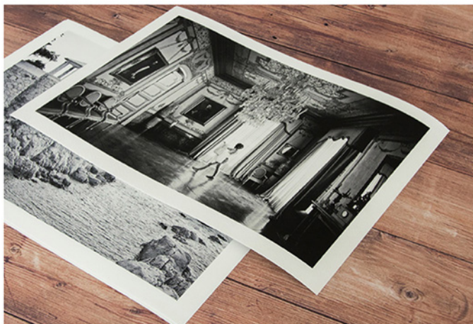
- Fine Art-