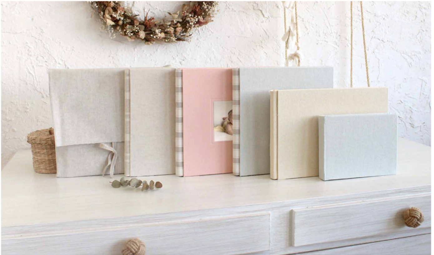
Colección Natural Cotton