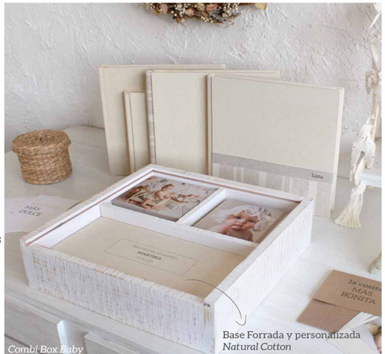
Combi Box Baby