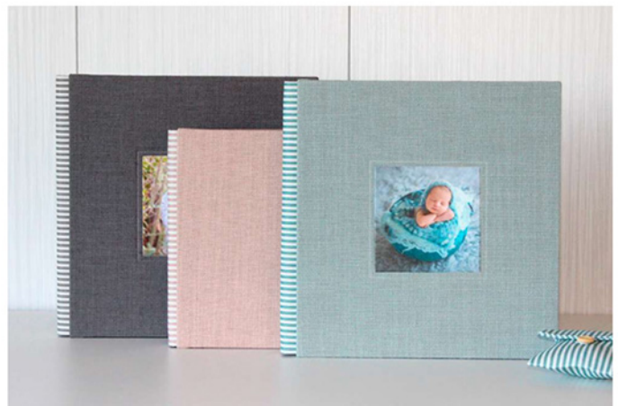
Colección Mün Baby