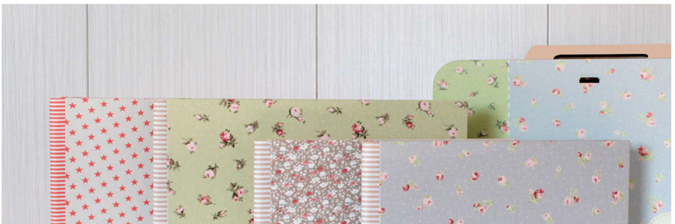
Colección Combi Kids