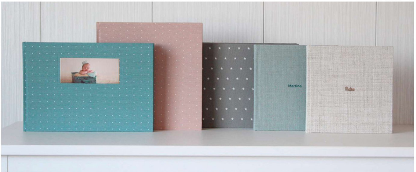
Colección Lino Nature