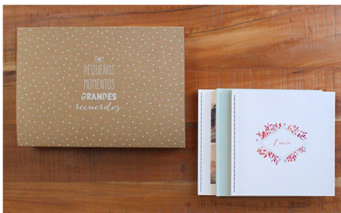
- FineBook -