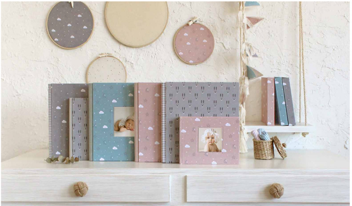
Colección Sweet Baby