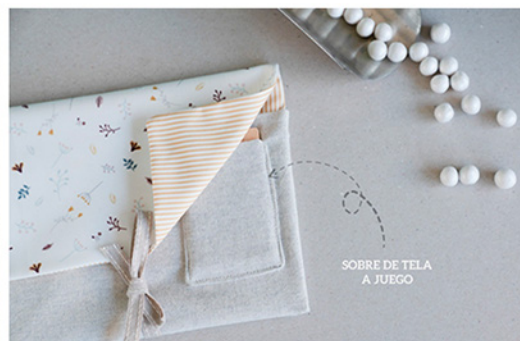
-Sobres de Tela-