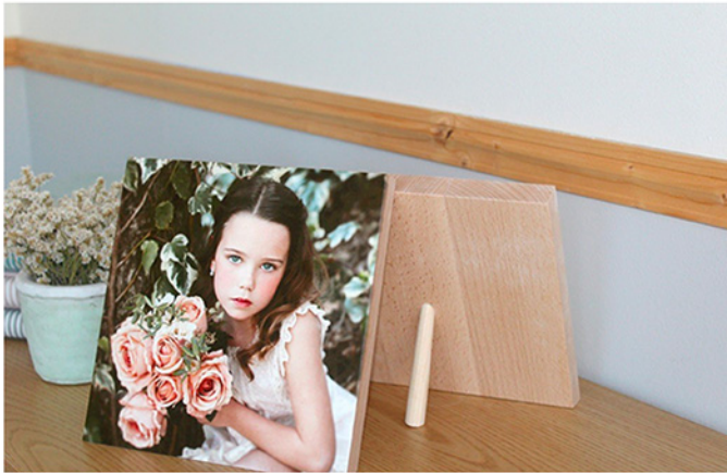
- Mini DecoWood -