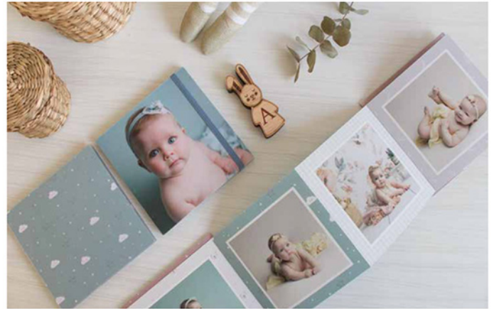
- Acordeón Print -