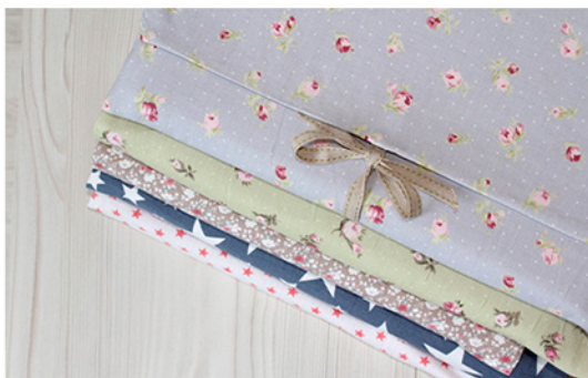
-Sobres de Tela-