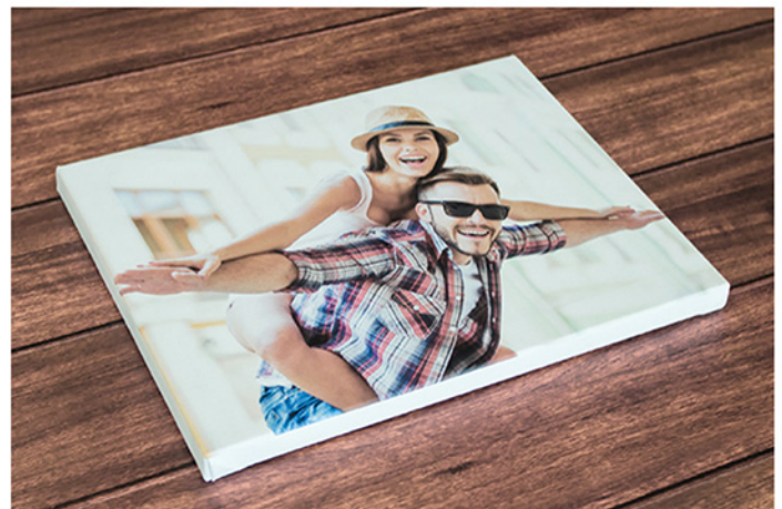
- Lienzo -