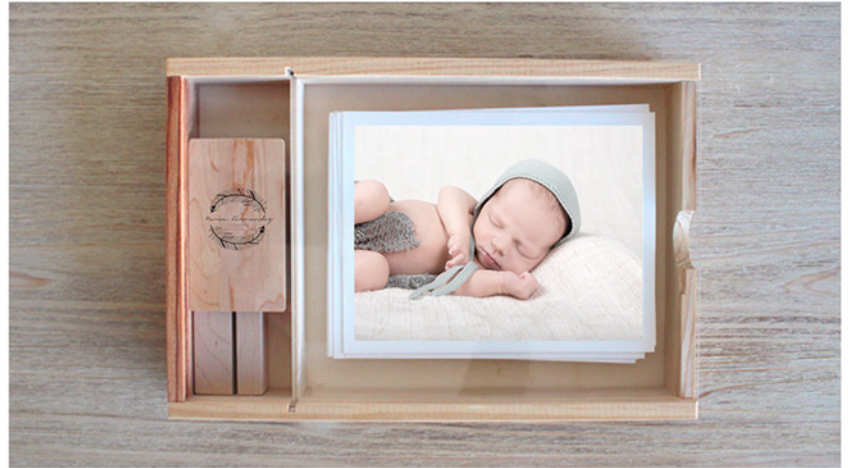
-Caja de madera PhotoNature-