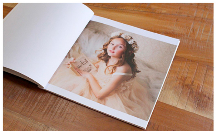
- FineBook -