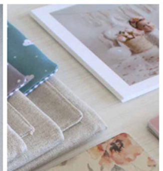
-Sobres de Tela-