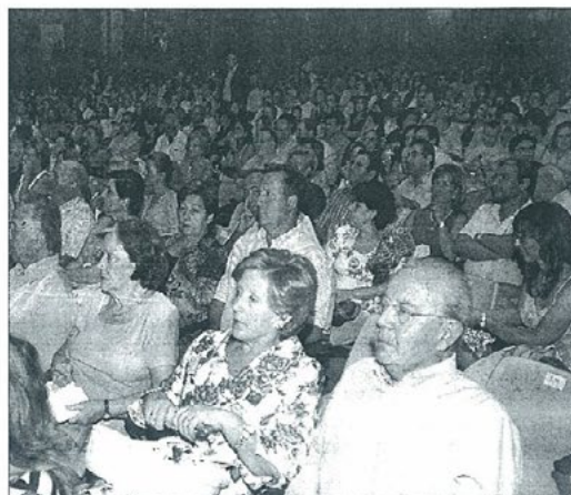
Numeroso público asistió al concierto de Amaranto el viernes.