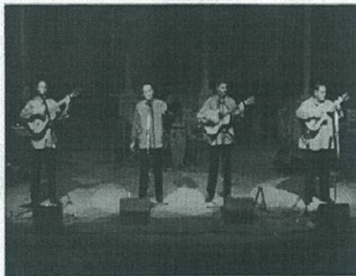
"Amaranto" dio todo un recital de buena música el pasado miércoles por la noche en el Auditorio.