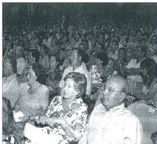
Numeroso público asistió al concierto de Amaranto el viernes.