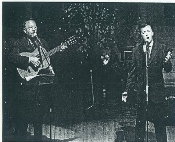
El cuarteto deleitó al numeroso público presente en el concierto con un completo y cuidado repertorio.