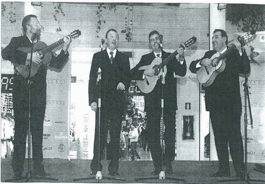
El grupo Amaranto presentó ayer en la plaza central del centro comercial La Loma su último trabajo discográfico.

MÚSICA ■ EL GRUPO TIENE ENTRE SUS PROYECTOS OTRO COMPACTO QUE ESPERAN PRESENTAR EN PRIMAVERA