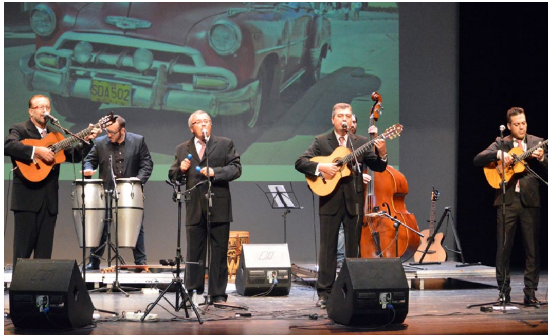
Noche de Boleros. Fotografía de su concierto en Jaen en la gira 2011

El género es identificable por algunos elementos rítmicos y nuevas formas de composición que aparecieron en el quehacer musical en la isla de Cuba durante el siglo XIX. Aunque comparte el nombre con el bolero español, que es una danza que surgió en siglo XVIII y se ejecuta en compás ternario de 3/4, el género cubano desarrolló una célula rítmica y melodía diferente, en compás de 4/4.