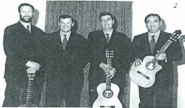
Los componentes de Amaranto la noche que actuaron el programa El Jaén Rosa TV.

Han sido los grandes triunfadores del verano 2000. El cuarteto Amaranto -único grupo español especializado en boleros- ha alcanzado un éxito sin precedentes. Más de una docena de conciertos por distintas localidades con una magnífica respuesta de público. Pero ahí no queda la cosa, Amaranto proyecta actuar los próximos meses en teatros de toda España.