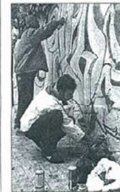
Jóvenes graffiteros de Jaén.

JAÉN ■ La expresión gráfica llega a Jaén de la mano de la cultura del Hip-hop. Desde hoy miércoles hasta el próximo domingo, los graffiteros jiennenses tienen una cita en el Instituto de Enseñanza Secundaria (IES) de Santa Catalina de Alejandría. El Instituto Andaluz de la Juventud (IAJ) ha organizado el primer Taller Práctico de Iniciación al Graffiti, que impartirá la Asociación Juvenil Graff B, de Baeza, que se llevará a cabo en las instalaciones de este centro educativo. Más de veinte jóvenes se han inscrito a un curso que pretende dar respuesta y, al mismo tiempo, satisfacer una demanda existente entre un sector de la población juvenil. El curso, de cinco días de duración, busca también ofrecer una perspectiva amable de