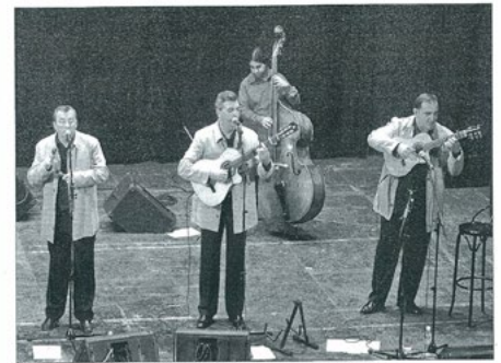
CONCIERTO. Entrega e ilusión de Amaranto sobre las tablas del Teatro Darynelia.