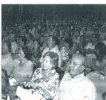
Número público acude al concierto de Amaranto al alman.