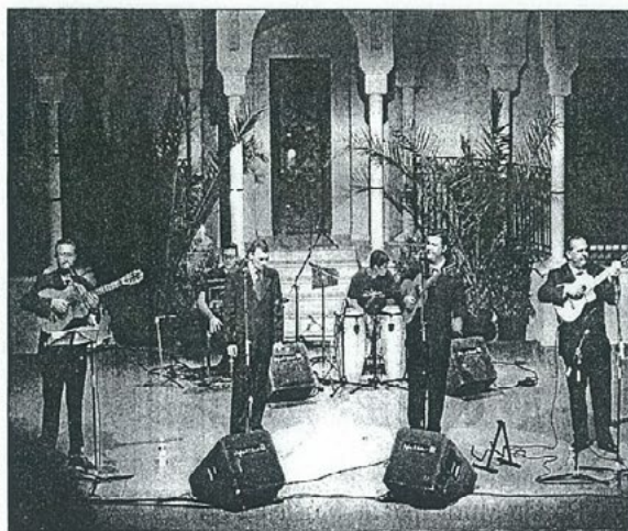
Momento de la actuación del grupo jienense “Amaranto” en la “Noche de Boleros” en el Auditorio.