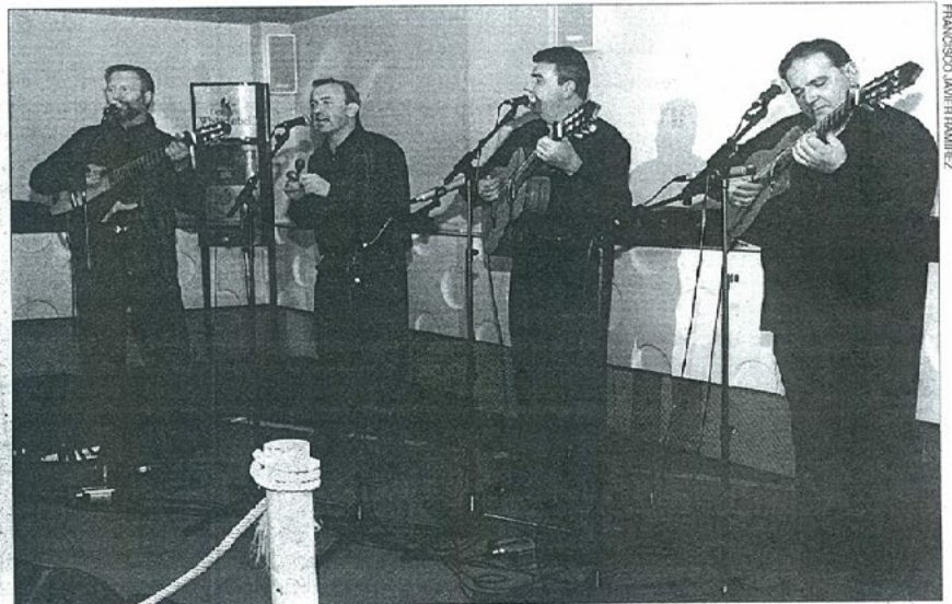
El cuarteto jienense Amaranto, durante el concierto ofrecido en la sala Miscelánea de Mancha Real.