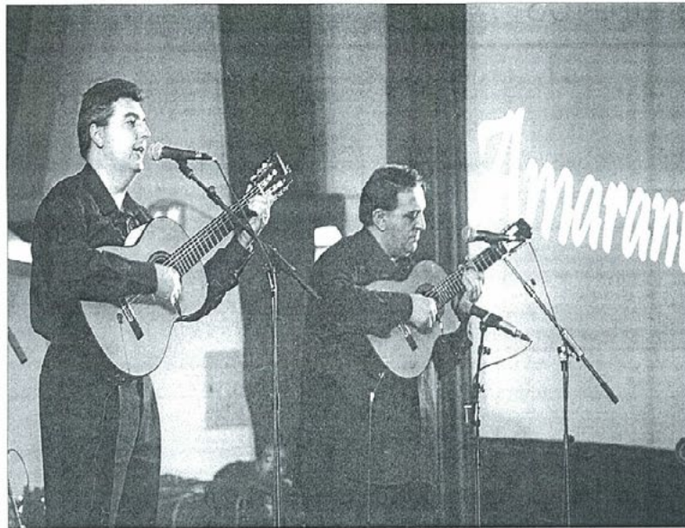
El grupo Amaranto, durante su actuación en el Aula Magna de la Universidad.

FESTIVAL ■ UN LAZO NEGRO PRESIDE EL ESCENARIO DEL AULA MAGNA DE LA UNIVERSIDAD DE JAÉN