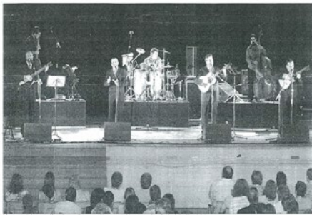
Momento de la actuación del grupo jienense Amaranto celebrada en el auditorio de La Alameda.

CONCIERTO EN NÚMERO PÚBLICO ACUDE A LA ACTUACIÓN CELEBRADA EN EL AUDITORIO DE LA ALAMEDA