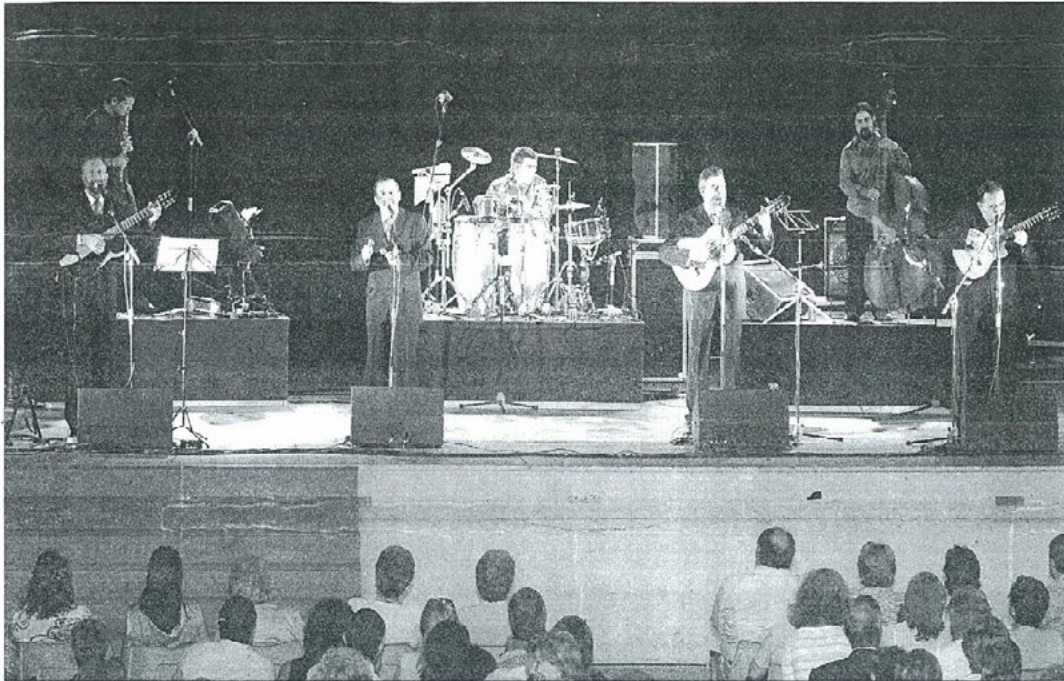
Momento de la actuación del grupo jiennense Amaranto celebrada en el auditorio de La Alameda.

CONCIERTO ■ NUMEROSO PÚBLICO ACUDE A LA ACTUACIÓN CELEBRADA EN EL AUDITORIO DE LA ALAMEDA