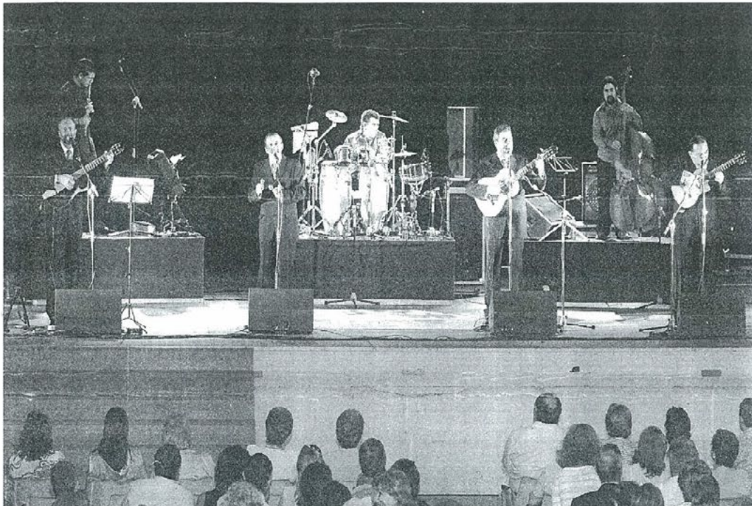
Momento de la actuación del grupo jiennense Amaranto celebrada en el auditorio de La Alameda.

CONCIERTO ■ NUMEROSO PÚBLICO ACUDE A LA ACTUACIÓN CELEBRADA EN EL AUDITORIO DE LA ALAMEDA