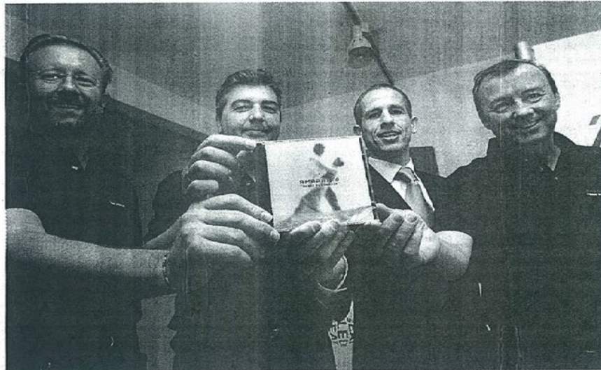
NUEVO DISCO. Los componentes de Amaranto sosteniendo 'Desde el corazón'.