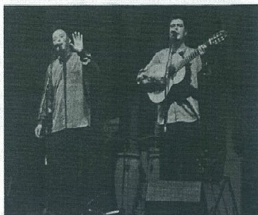
Momento de la "Noche de Boleros" en el Auditorio del Parque de la Constitución.