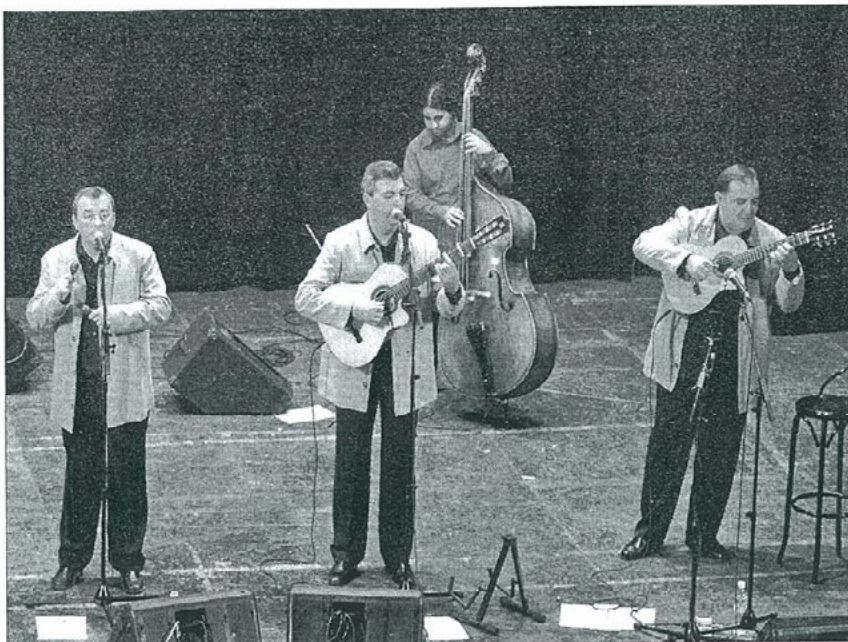
CONCIERTO. Entrega e ilusión de Amaranto sobre las tablas del Teatro Darymelía.